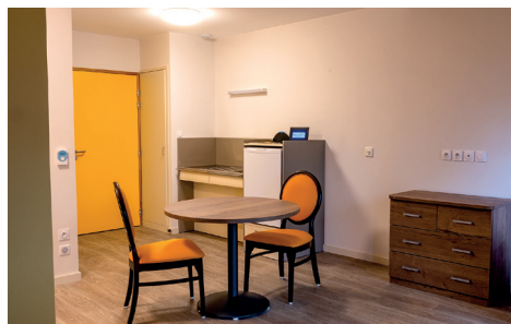
Logement temporaire - Entrée, cuisine