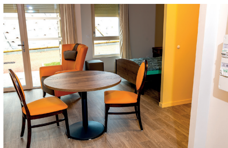
Logement temporaire - Séjour, chambre

1 logement temporaire meublé pour l'accueil de personne jusqu'à 3 mois.